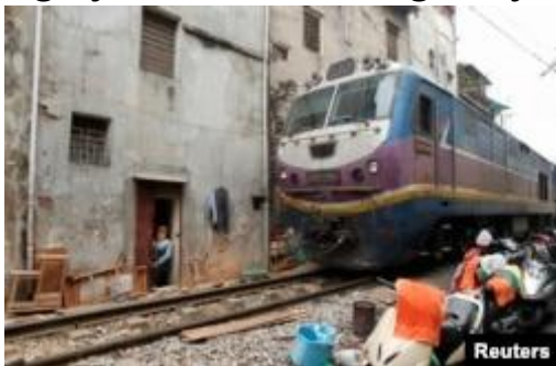
Tàu hỏa chạy sát nhà dân ở Hà Nội, tháng 12/2011.

“Nếu giá vé được tính đủ thì hành khách đi Hà Nội-Tp.HCM chẳng dại gì đi tàu trừ những người muốn đi trải nghiệm. Khi đó, đường sắt cao tốc lấy tiền đâu để trả nợ vay?” vị giảng viên viết và chỉ ra thế khó của đề án: “Nếu hạ giá vé xuống bằng máy bay thì tiền đâu để bù lỗ hàng ngày cho hệ thống này vận hành?”